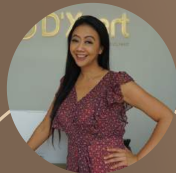
Asri Welas Actress

"Aku sampe rekomendasiin ke temen-temenku untuk treatment disini, seneng banget tempat nyabersih, treatment nya up to date, hasilnya bener-bener signifikan"