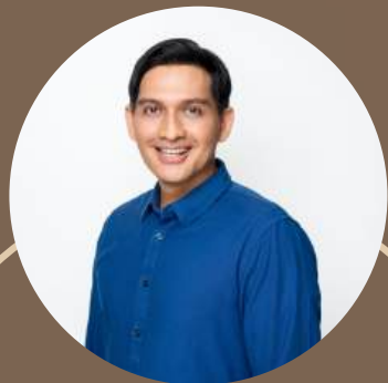
Lucky Hakim Actor

"D'Xpert Clinic mampu membuat wajahku terlihat 10 tahun lebih muda"